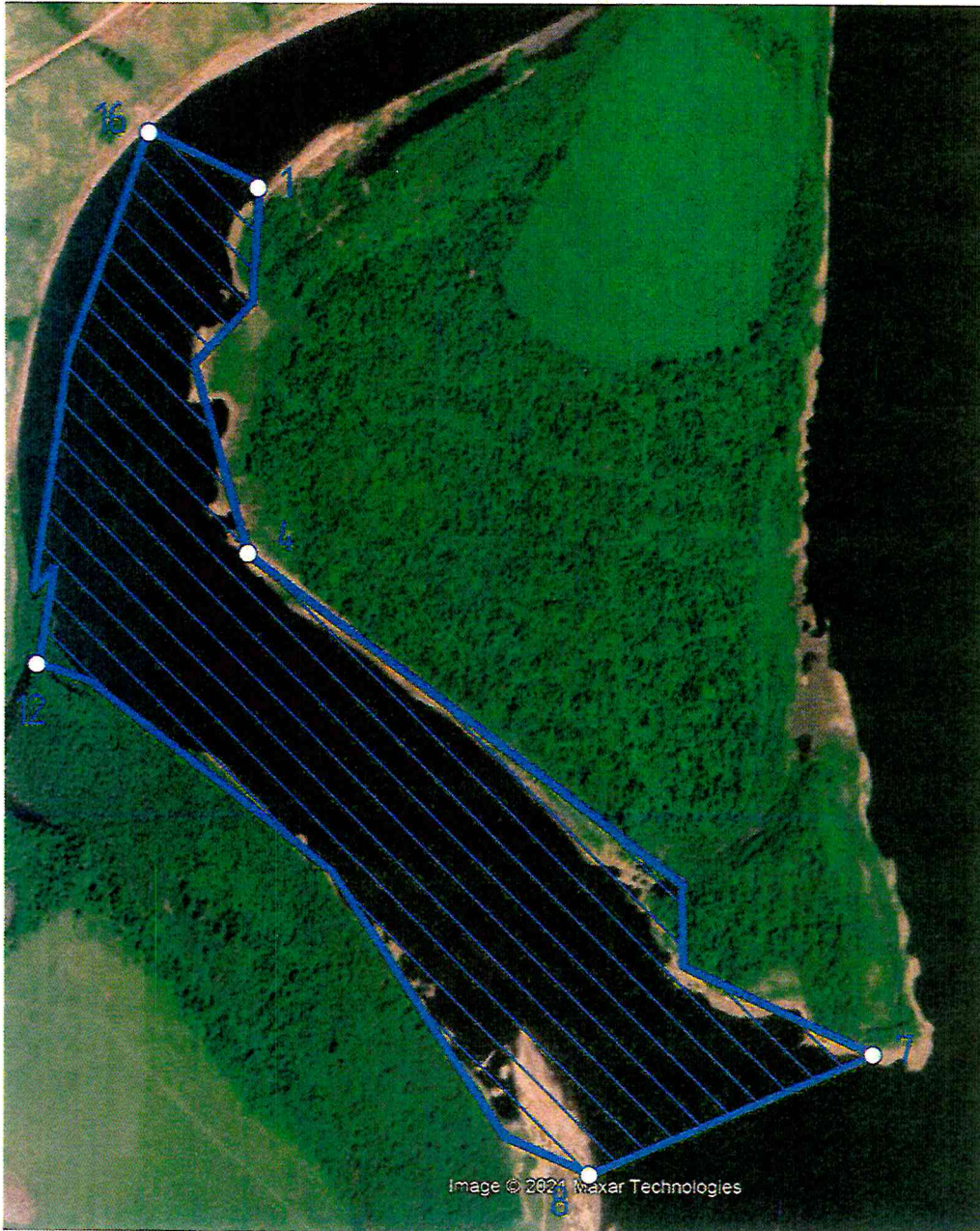
Схема размещения водного объекта протока Малая Светлая в пользование месторождение песчано-гравийной смеси на Айдаковском (русловом) месторождении (протоки Светлая, Калтайская р.Томы, юго-западная часть о.Светлый) АО «Томская судоходная компания»

Схема размещения гидротехнических и иных сооружений, расположенных на водном объекте, обеспечивающих возможность его использования для нужд Водопользователя